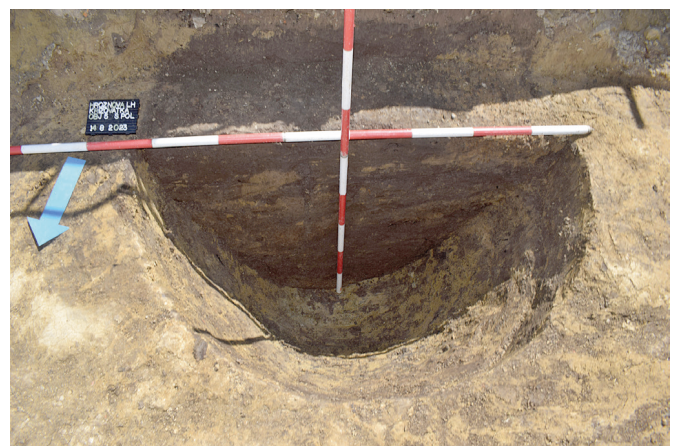
Obr. 55. Hrozenová Lhota. Objekt č. 5 – zásobní jáma.

Z důvodu zemních prací při úpravě hlavní křižovatky v Hrozenové Lhotě v srpnu 2023 byla provedena první fáze záchraného archeologického výzkumu (první polovina komunikace) pracovníky Masarykova muzea, p. o. V průběhu odkryvu bylo zdokumentováno 19 zahloubených objektů. Minimálně v pěti případech šlo o lépe zachované kruhové jámy původně zásobního účelu (obr. 55) a ve dvou případech se jednalo o pyrotechnologické zařízení s pecí zřejmě potravinářského účelu (obr. 56). Dále byl objeven příkopovitý útvar, který tvořil nejspíše součást ohrazení starší vesnice, a tři liniové úzké žlaby, jež mohly sloužit pro odvodnění prostoru na zdejších mírně klesajících svahu. Dobře dochován byl jeden typický kanálek se stěnami z pečlivě vyskládaných kamenů a se stříškou z plochých kamenných ploten.