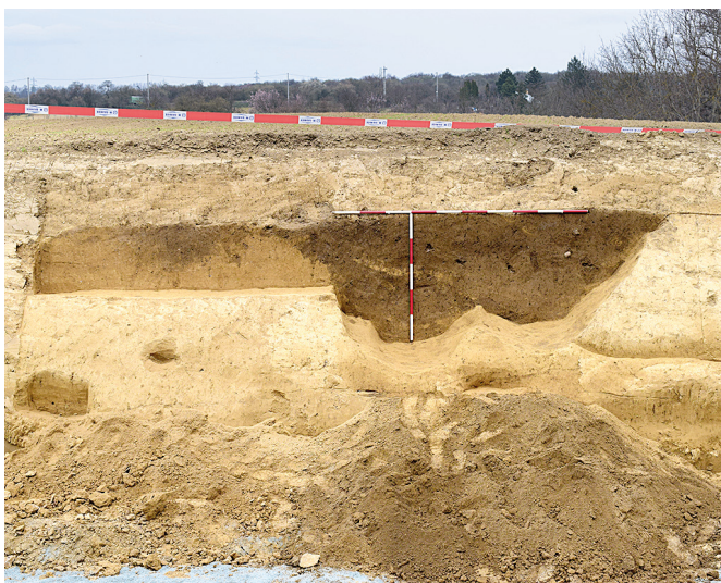
Obr. 49. Hajany. Fotografická dokumentace profilu příkopu.

V průběhu archeologického dohledu při rekonstrukci silnice II/152 Hajany – Želešice byly zachyceny archeologické situace pouze v k. ú. Hajany, a to při zemních pracích spočívajících ve svahování břehu silnice a skrývce během výměny konstrukčních vrstev komunikace. Bylo zachyceno celkem sedm archeologických objektů (obr. 49). Objekty 500 a 501 představují zbytky zanesených žlabů probíhajících kolmo ke stávající vozovce, objekt 502 pak hlubší příkop. Z objektu 502 pocházejí nálezy ze 13. století. Ačkoliv z objektů 500 a 501 žádné nálezy nepocházejí, je pravděpodobné, že spolu mohou souviset a spadat do stejného období. Příkop 502 je navíc zachycený na leteckých fotografiích z let 1998 a 1999, kdy je zřejmé, že opisuje mírný oblouk zprvu kopírující v cca 30–40m vzdálenosti těleso silnice ze Želešice a postupně se stáčí západním směrem k obci (obr. 50). Interpretace této situace není jasná, pro katastr Hajan nejsou k dispozici zprávy o tom, že by v těchto místech byla situována