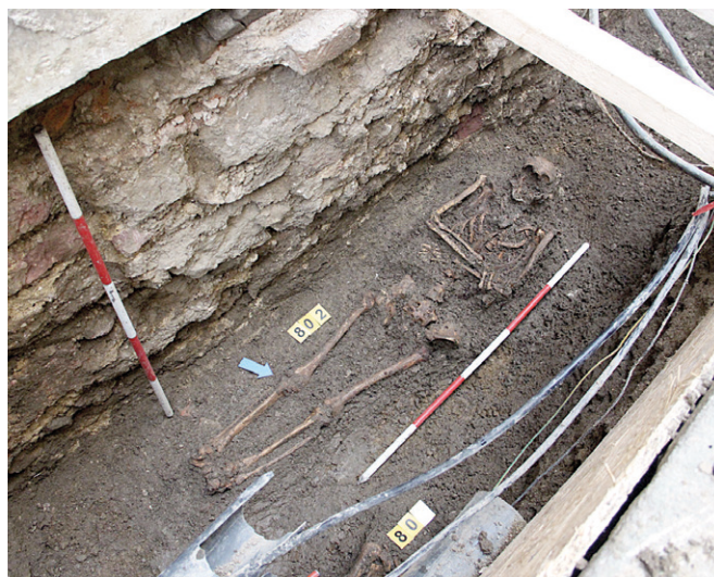
Obr. 20. Brno, ulice Petrov. Jeden z pohřbů.