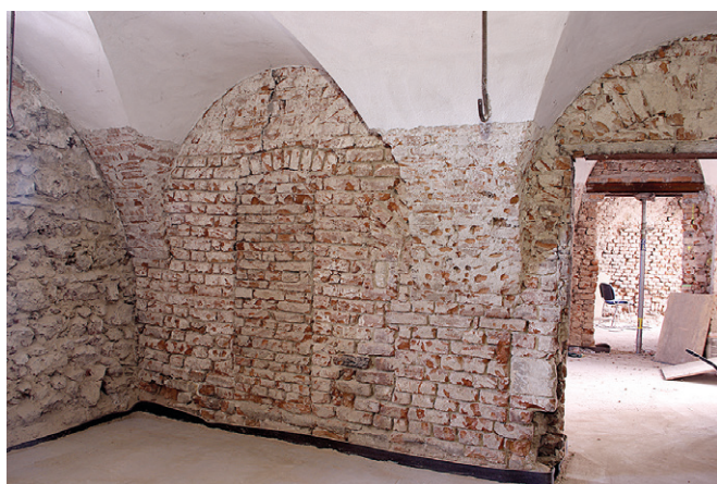
Obr. 19. Brno, ulice Petrov. Středověké konstrukce dvorního křídla domu při městské hradbě (vlevo).