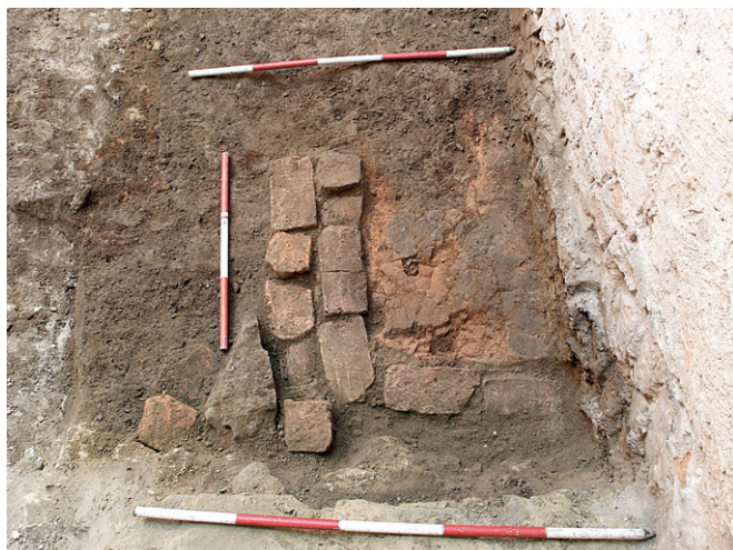
Obr. 18. Brno, ulice Petrov. Segment otopného zařízení v úrovni podlahy dřevohliněného domu.