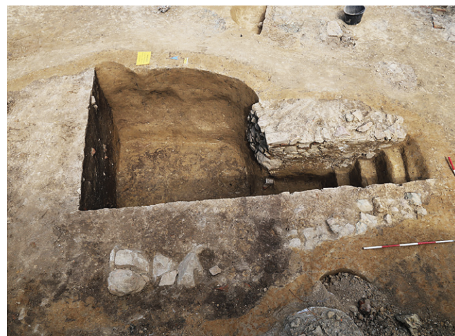
Obr. 7. Brno, ulice Kollárova. Sondáž jednoho ze sklípků (pohled od západu), který zanikl nejdříve po roce 1805.

Řepa, M. a kol. 2004: Dějiny Králova Pole. Brno: Úřad městské části Brno–Královo Pole.