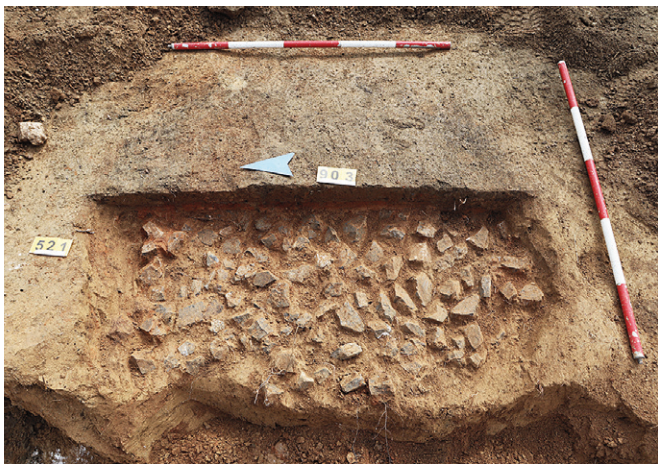
Obr. 8. Brno-Líšeň, ulice Houbařská. Dno středohradištní pece s akumulací kameny.

Ve střední části plochy byl dokumentován protáhlý objekt, který by snad mohl být pozůstatkem středověkého či novověkého úvozu.