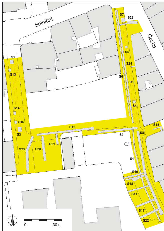
Obr. 9. Brno, ulice Besední a Veselá. Žlutě je vyznačena plocha staveniště, šedě dokumentované sondy. Autor Archaia Brno z. ú.

V roce 2023 bylo ukončeno zpracování výsledků záchranného archeologického výzkumu, který byl realizován v souvislosti se stavbou „Brno, Besední, Veselá II – rekonstrukce kanalizace a vodovodu“. Jeho provedení zajistila společnost Archaia Brno z. ú.