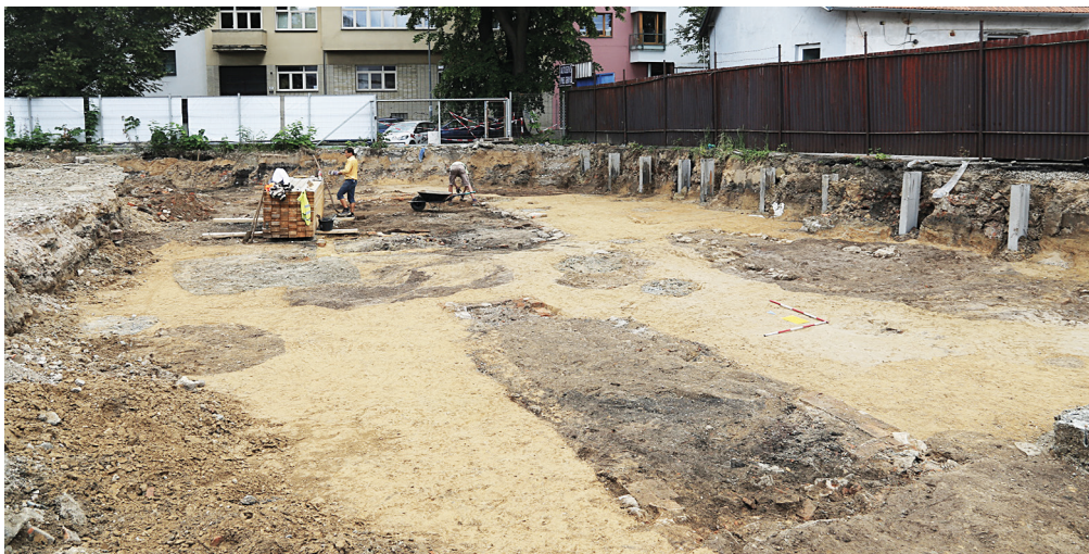
Obr. 6. Brno, ulice Kollárova. Jižní část zkoumané plochy. Pohled od severu.