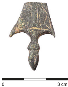
Obr. 2. Bílá Lhota. Fragment opaskového nákončí.