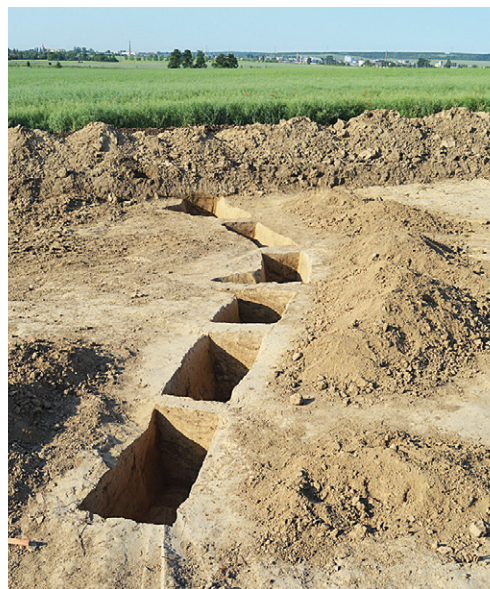
Obr. 4. Brno – Dolní Heršpice. Výzkum pěchotního okopu jednotlivými řezy.

Kos, P. 2024: Brno (k. ú. Dolní Heršpice, okr. Brno-město). Přehled výzkumů 65(1), 222–223.