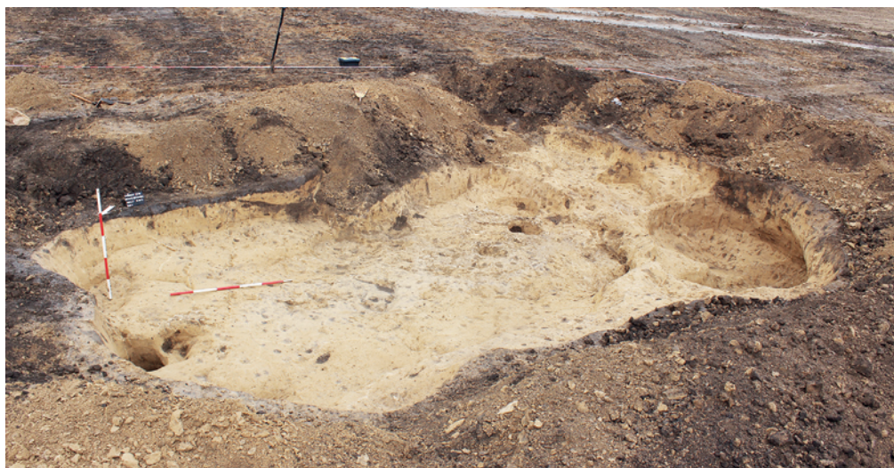
Obr. 17. Vyškov. Rozsáhlá polozemnice s dochovaným torzem sprášeové lavice.