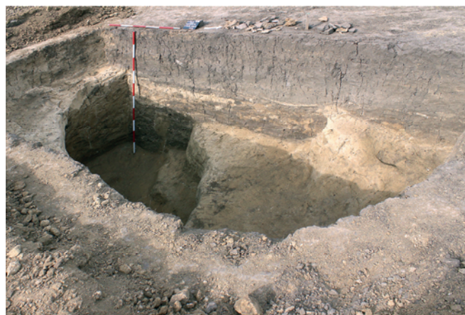
Obr. 18. Vyškov. Profil laténské polozemnice se sklípkem.

Během výzkumu jsme získali bohatý soubor nálezů. Jedná se především o keramiku (obr. 19; různé tvary, objevuje se i typická kolkovaná výzdoba), keramické přesleny a textilní závaží, kostěné nástroje – hlavně různé druhy šidel, kamenné obdélníkové žernovy. Díky preciznímu dohledávání detektorem kovů jsme získali i pěkný soubor železných a bronzových předmětů (různé zlomky nožů, jehly, jehlice, bronzovou sponu). Toto časně laténské sídliště je velmi rozsáhlé. Další objekty, které byly jeho součástí, jsme našli již během výzkumů v předchozích letech i na okolních parcelách (všechny haly společnosti BKR ČR; Čižmářová 2004, 345; Geislerová, Parma 2013, 304–305; Meduna 1964, 39; Šedo 1985).