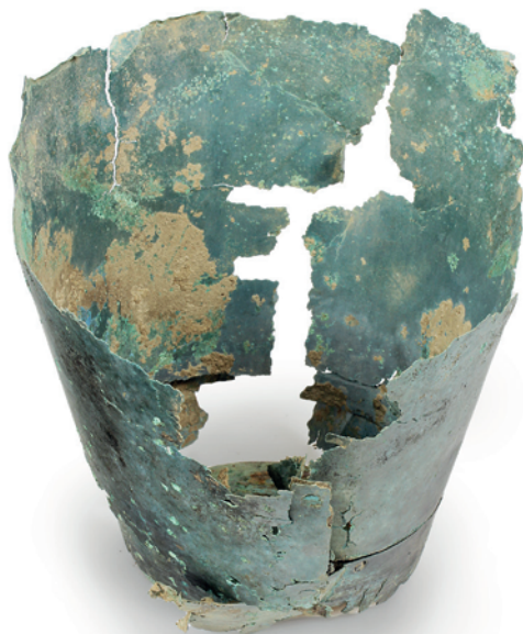
Obr. 13. Mohelnice. Fotodokumentace nálezu bronzové nádoby po základním očištění.