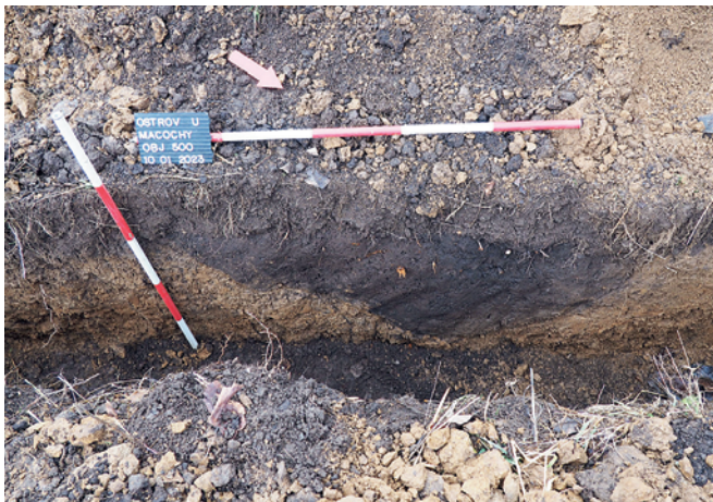
Obr. 16. Ostrov u Macochy. Jihozápadní profil objektu 500.

Fig. 16. Ostrov u Macochy. Southwestern profile of sunken feature 500.