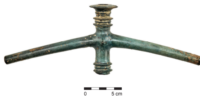
Obr. 13. Olomouc. Bronzový dvojramenný mlat.

Stuchlík, S. 1988: Bronzové sekeromlaty na Moravě. Památky archeologické LXXIX(2), 269–328.