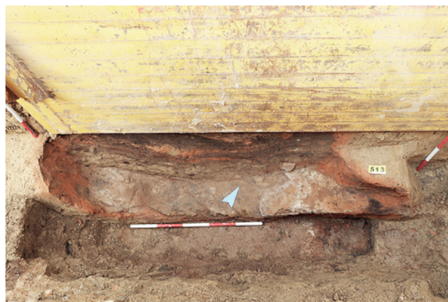
Obr. 10. Modřice. Pec ve výkopu kanalizace ve Střední ulici.

Mezi objekty budí pozornost především pozůstatky až tří pecí, které byly zaregistrovány blízko sebe ve Střední ulici (obr. 10). Poměrně značné rozměry, které bylo možno rekonstruovat u dvou pecí (průměr cca 100 a 160 cm), mohou naznačovat výrobní charakter. Pece se nacházely trochu stranou od dalších objektů dokumentovaných v bezejmenné uličce, kde byly zjištěny až čtyři hliníky.