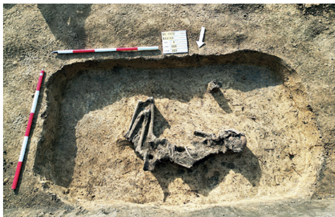
Obr. 2. Blatec. Blíže nedatovaný kostrový hrob.

Tajer, A. 2001: Nálezová zpráva ze záchranného archeologického výzkumu . Rkp. nálezné zprávy, č. j. M-TX-200202396 [cit. 2024-03-12]. Uloženo: Archiv nálezných zpráv Archeologického ústavu AV ČR, Brno, v. v. i. Dostupné také z: Digitální archiv Archeologické mapy České republiky https://digiarchiv.aiscr.cz/id/M-TX-200202396 .