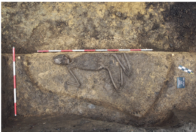
Obr. 14. Pravčice. Kanalizační rýhou porušený hrob s kostrou ve skrčené poloze.

Při budování základní technické vybavenosti v lokalitě Pravčice – Němčická ulice byly částečně prozkoumány dvě archeologické situace. Jednalo se o zemní rýhou narušený kostrový hrob muže, uloženého v rituální skrčené poloze na pravém boku s výrazněji pokrčenými nohama, pravou rukou pokrčenou před obličejem a druhou (výrazně porušeno hlavní zemní rýhou pro pokládku kanalizace a vodovodu) nejspíše také pokrčenou a směřující do oblasti pánve (obr. 14). Jedinec byl uložen v rozměrnější