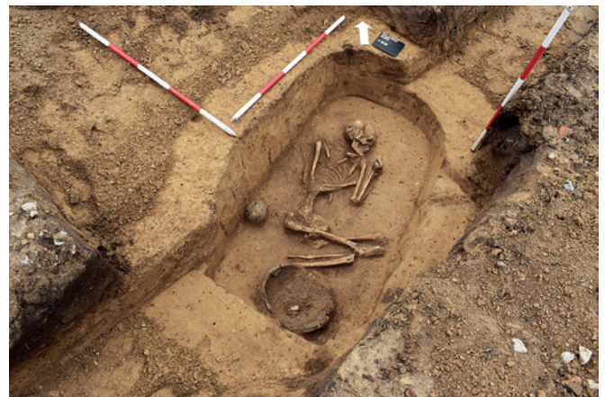
Obr. 15. Rajhrad. Hrob kultury se zvoncovitými poháry.

Výzkum navázal na odkryvy v letech 2013 (Parma, Kos 2014) a 2017 (Bíško et al. 2018), kdy bylo zjištěno a prozkoumáno pohřebiště z období kultury se zvoncovitými poháry a z období halštatu.