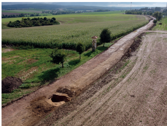
Obr. 12. Pačlavice. Letecký pohled na místo výzkumu. Fig. 12. Pačlavice. Aerial view of the excavation area.