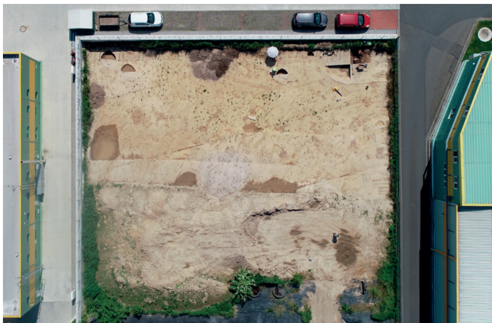
Obr. 11. Otice. Pohled na výzkum z ptačí perspektivy (snímek pořízen pozemním vrtulníkem DJI PHANTOM 4 PRO+).