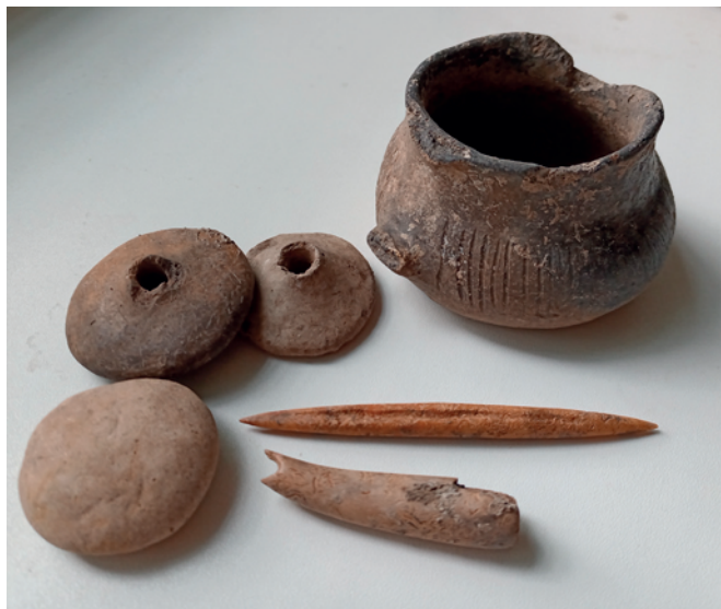
Obr. 7. Dub nad Moravou. Výběr nálezů z objektu kultury nálevkovitých pohárů.

Šmíd, M. 2017: Nálevkovité poháry na Moravě . Pravěk. Supplementum 33. Brno: Ústav archeologické památkové péče Brno, v. v. i.