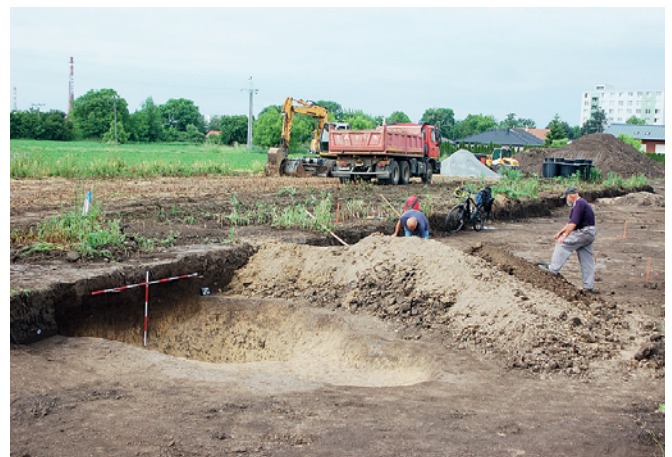
Obr. 8. Prostějov. Pohled na plochu archeologického výzkumu. Fig. 8. Prostějov. View of the excavation area.