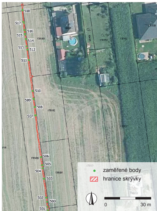
Obr. 7. Pišť. Zaměření jednotlivých objektů ve výřezu katastrální mapy. Grafika T. Petr. Fig. 7. Pišť. Location of individual features in an excerpt from the cadastral map. Graphic by T. Petr.