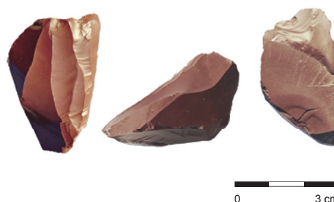
Obr. 26. Štítná nad Vlárí-Popov. Radiolaritové jádro.

Fig. 26. Štítná nad Vlárí-Popov. Radiolarite core.