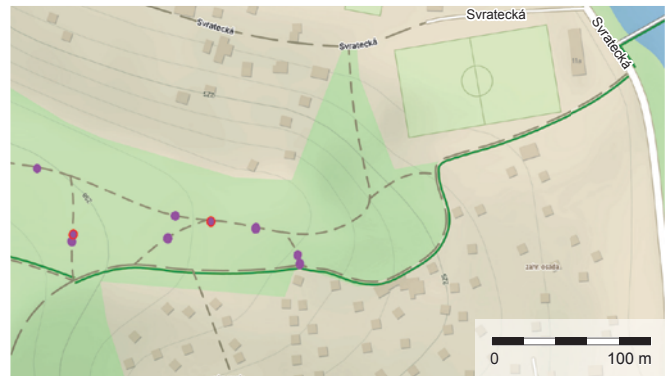
Obr. 4. Brno-Jundrov. Mapa lokality s vyznačením poloh posledních nálezů. Autor P. Šmacha.