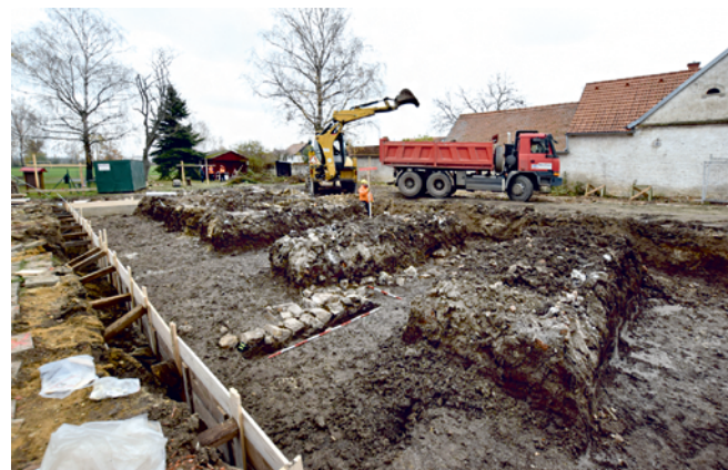
Obr. 62. Suchohrdly u Miroslavi. Pohled na plochu výzkumu.

V roce 2020 byly v bezprostřední blízkosti kostela zahájeny bourací práce budovy bývalé mateřské školy a v tomtéž místě byla zahájena výstavba nové budovy se sociálními byty. Na profilech základových pásů byla patrná souvrství skládající se ze zásypu, který souvisel s odstraněním podlahy, se staršími stavebními úpravami a s regulacemi, které vyrovnávaly stávající terén. V nejširším základovém pásu hlavní budovy jsme lokalizovali kamenný základ starší stavby. Movité nálezy, které by blížely situaci datovaly, bohužel zjištěny nebyly. Jiná situace nastala při pokračování archeologického výzkumu v roce 2021 u výkopu pro kanalizaci v prostoru mezi novou budovou a jižní stranou kostela (obr. 62). Na první pohled bylo patrné převrstvení terénu. Na profilech byly zřetelné starší výkopy včetně linie starého potrubí. Obnažen byl také nový systém odvodnění kostela z roku 2010. Historické vrstvy byly silně poničeny zásypy. Velmi ojediněle byl získán střepový materiál, který dopomohl k datování nálezové situace do pozdního středověku a raného novověku.