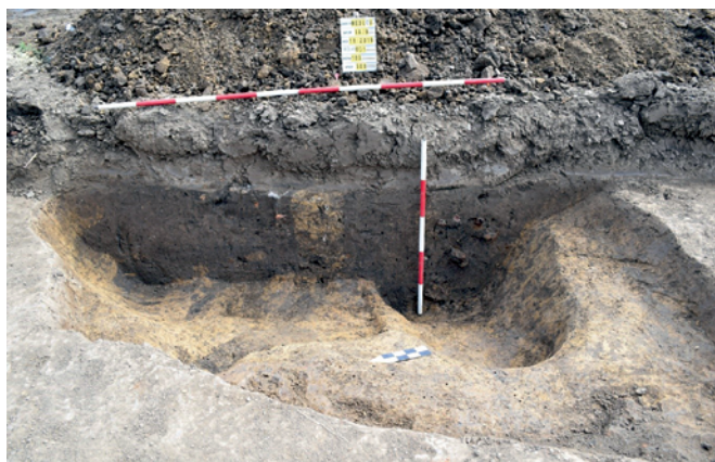
Obr. 48. Medlov. Objekt 1.