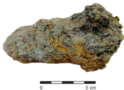
Obr. 49. Medlov. Železitá struska z objektu 1.