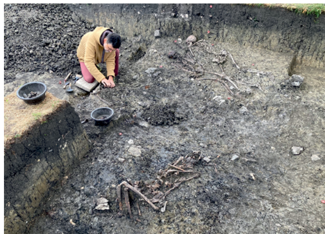
Obr. 50. Mikulčice. Výzkum DV 2022, preparace kosterních pozůstatků nestandardně uložených jedinců v požárové vrstvě.

Poláček, L. 2008: Das Hinterland des frühmittelaltelichen Zentrums in Mikulčice. Stand und Perspektiven der Forschung. In: L. Poláček (Hrsg.): Das wirtschaftliche Hinterland der frühmittelalterlichen Zentren . Spisy Archeologického ústavu AV ČR Brno 31. Internationale Tagungen in Mikulčice VI. Brno: Archäologisches Institut der Akademie der Wissenschaften der Tschechischen Republik, Brno, 257–297.