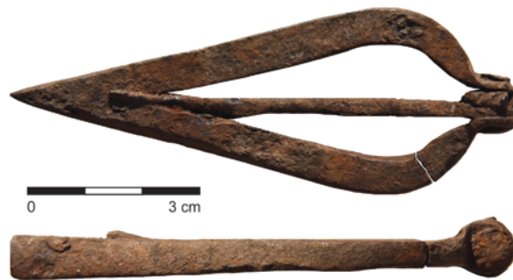
Obr. 38. Kozlov. Železná ocílka.

V případě exempláře z Kozlova se jedná o první známý nález ocílky kapkovitého či mandlovitého tvaru opatřené středovým trnem na Přerovsku. V rámci Olomouckého kraje lze uvést obdobný nález z lokality Doubravice na Šumpersku (Faltýnek, Hlubek 2022, 88, 90, obr. 5: 3). Další analogická varianta křesadla pochází z lokality Nová Sídla – Chlum v Pardubickém kraji. Obecně je tento typ křesadel možné datovat pouze rámcově od 13. do 16. století (Vích, Žákovský 2012, 96–97, 113, obr. 6).