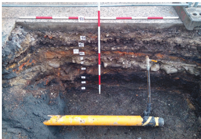
Obr. 37. Kopřivnice. Novověké a pozdně středověké souvrství.