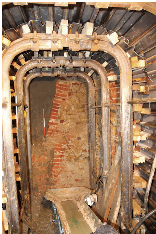
Obr. 7. Brno, Komenského náměstí. Na čelbě ražby je patrné vyzdění kontreskarp novověkého příkopu.

Zůbek, A. 2022: Nálezová zpráva o provedení záchranného archeologického výzkumu při stavbě „Brno, Solniční I, Česká II, Opletalova – rekonstrukce kanalizace a vodovodu“ . Rkp. nálezové zprávy, č. j. MTX202200314 [cit. 2023-10-02]. Uloženo: Archiv nálezových zpráv Archeologického ústavu AV ČR, Brno, v. v. i. Dostupné také z: Digitální archiv Archeologické mapy České republiky https://digiarchiv.aiscr.cz/id/M-TX-202200314 .