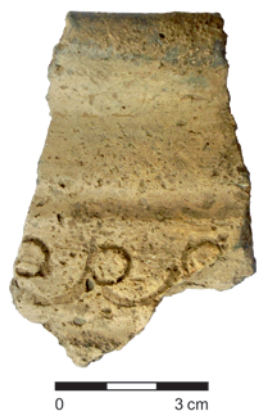
Obr. 18. Slatinice – „Na Stráži“. Zlomek nádoby.