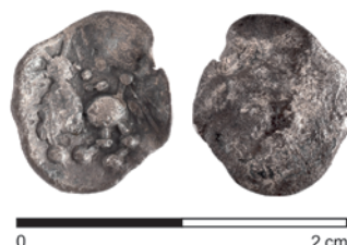
Obr. 20. Těšetice. Laténská stříbrná mince – obol.

Kolníková, E. 2006: Nové nálezy mincí – příspěvek k obrazu doby laténské na Moravě. Pravěk. Nová řada 16, 437–462.