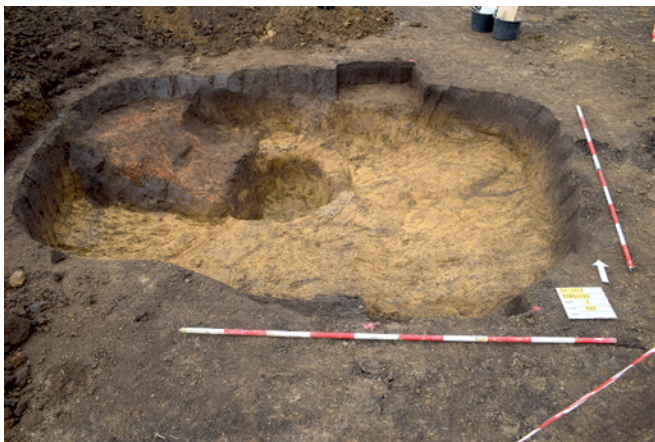
Obr. 15. Rataje. Půdorys zemnice s otopným zařízením.

Keramický inventář je význačný častou přítomností grafitu v těstě. Paralelně s keramikou v ruce robenou se objevují i tmavé střepy se stopami výroby na hrnčířském kruhu. Ze souboru výrazně vystupují hlavně fragmenty mís se zdobením vnitřní strany. Na jedné z nich, světlé, okrově šedé barvy a v ruce robené, je patrná rytá geometrická výzdoba v halštatském stylu svislých linií a kosočtverečných polí. Na vnější straně, při rozhraní hrdla a výdutí, byla nádoba zdobena drobnými přesečky. Druhý velký fragment představuje tmavou, šedočernou mísu vyrobenou na hrnčířském kruhu s výrazně členěným okrajem a kolkovanou výzdobou ve tvaru slunce/hvězdy uprostřed dna.