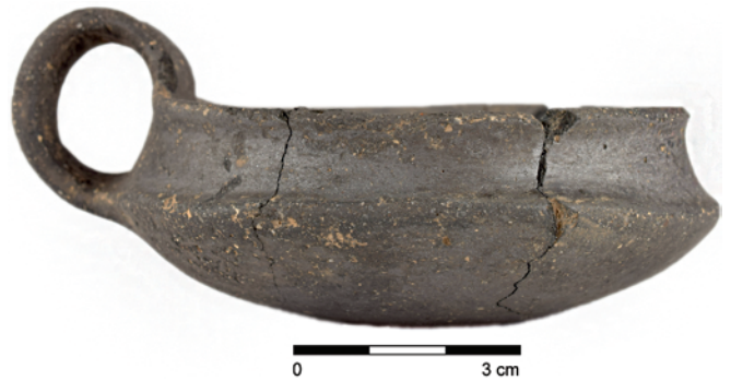
Obr. 17. Rataje. Šálek z výplně objektu.

Fig. 16. Rataje. Detail of the bowl base with a stamp decoration.