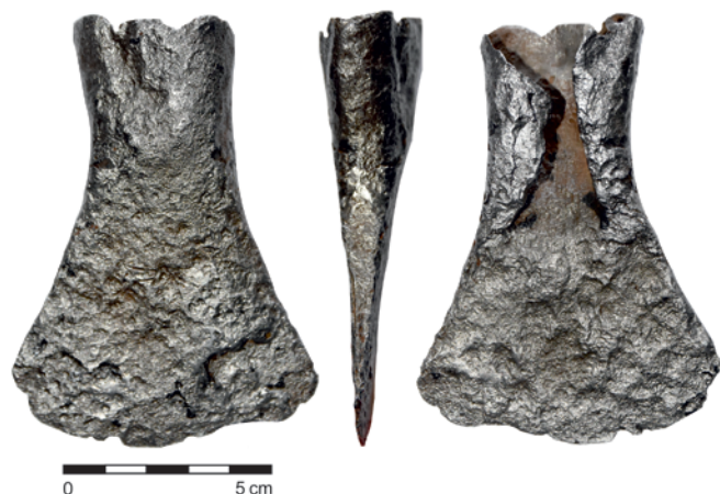
Obr. 6. Kozlov. Železná laténská sekera. Fig. 6. Kozlov. Iron axe from the La Tène period.

An isolated La Tène period iron axe (Fig. 6) was found in 2014 during a metal detector survey on the southern slope of Obírka