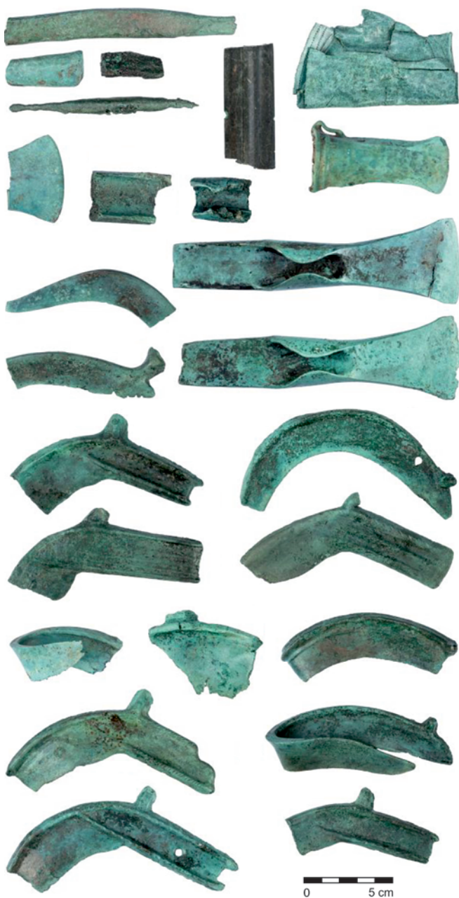
Obr. 26. Šebetov. Výběr předmětů z depotu Šebetov 6. Fig. 26. Šebetov. Selection of the finds from the Šebetov 6 bronze hoard.

Z okolí depotů Šebetov 4, Šebetov 5 a Šebetov 6 byly získány další bronzové zlomky a slitky dokládající přítomnost metalurgických dílen. Co se týká množství a hmotnosti surovinových slitků, tato sídlištní lokalita prozatím v oblasti celé Malé Hané nemá obdoby. Další lokalitou s doklady metalurgie, kde se objevily i celé slitky nebo jejich kusy, je lokalita Boskovice – Pod Lipníky. Zjišťujeme tak, že velké množství masivních zlomků slitků i celých exemplářů se jako součást depotů může objevit i mimo pro tento aspekt obvyklou oblast kultury středodunajských popelnicových polí (srovnej Salaš 2005, 129). S kumulací tří depotů Šebetov 4, Šebetov 5 a Šebetov 6 může souviset i zlomkový depot Šebetov 1 (214 kusů), který se našel v roce 2013 v polní trati „Bažantnice“ ve vzdálenosti asi 780 m od uvedené kumulace (Malach et al. 2016). Metalurgické aktivity v tomto prostoru včetně uložení čtyř depotů tak lze v rámci osídlení kultury lužických popelnicových polí předběžně datovat do její starší fáze.