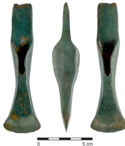
Obr. 24. Starý Jičín. Bronzová sekerka.

Salaš, M. 2005: Bronzové depoty střední až pozdní doby bronzové na Moravě a ve Slezsku I. Text; II. Tabulky . Brno: Moravské zemské muzeum.