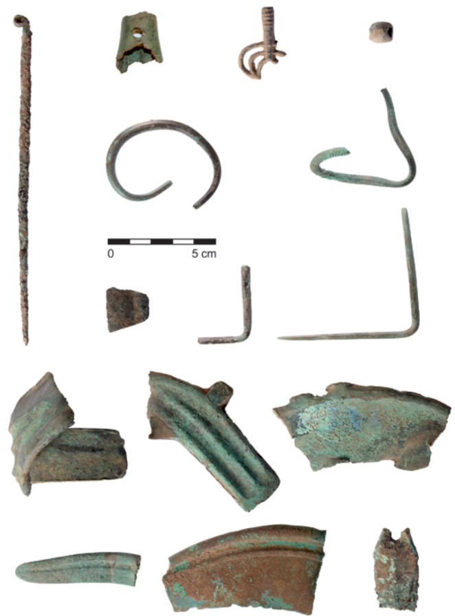
Obr. 21. Polešovice, „Nivky“. Vybrané artefakty z detektorové prospekce.

Vladár, J. 1974: Die Dolche in der Slowakei . Prähistorische Bronzefunde VI(3). München: Beck.