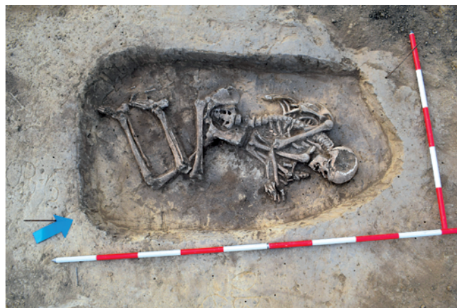
Obr. 7. Čejkovice. Skrčenec z hrobu č. 1.

V měsících květnu až prosinci 2022 prozkoumali pracovníci Masarykova muzea v Hodoníně, p. o., při zemních úpravách okolo předem neohlášené a v podstatě dokončené přístavby haly a parkoviště firmy Sonnentor v Čejkovicích sídliště a pohřebiště