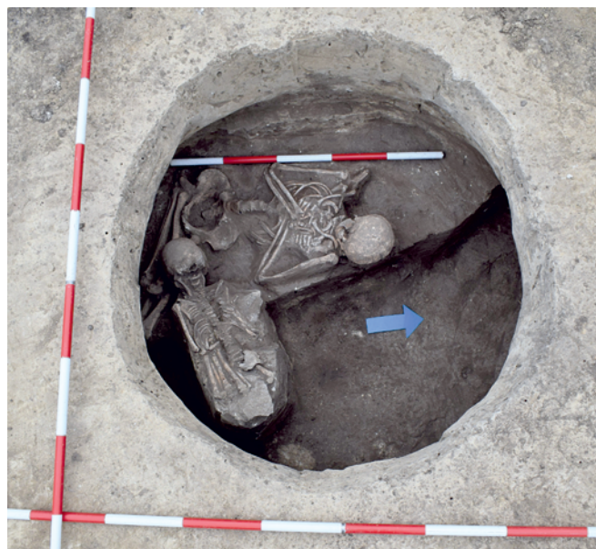
Obr. 9. Čejkovice. Dva lidské skelety ve výplni objektu č. 5.

Fig. 8. Čejkovice. A whole ceramic vessel on the bottom of Feature 1.