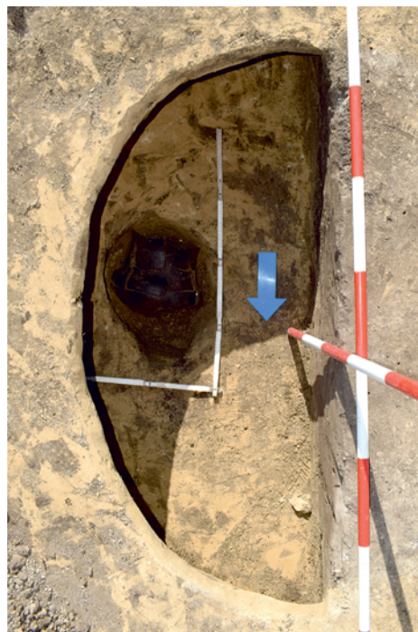
Obr. 8. Čejkovice. Kompletní keramická amfora na dně objektu č. 1.

ze starší doby bronzové. Tato první fáze výzkumu se odehrála na ploše (nekontrolovaně skryté již v předchozím roce bez oznámení archeologické instituci) pro dočasnou obslužnou komunikaci, buňkoviště, a zejména navazující značně objemnou deponii zeminy ze skrývky, kterou bylo nutné pro dodatečné prozkoumání přesunovat po jednotlivých pásech za sebou. Přinesla objev celkem čtrnácti sídlištních objektů a jednoho oválného hrobu se skeletem ve skrčené poloze na levém boku, bez průvodních milodarů (obr. 7). U sídlištních objektů se z velké většiny, podle kruhovitěho půdorysu s podhloubenými a rozšiřujícími se stěnami, jedná o zásobní jámy. Mimo obligátní nálezy z výplně sídlištních