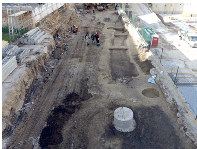
Obr. 5. Brno-Zábrdovice, ul. Cejl. Pohled od jihu na příkop z pozdní doby bronzové.

Bučo, A. 2023: Nálezová zpráva o provedení záchranného archeologického výzkumu při stavbě „Rezidence Pekárenský dvůr“ . Rkp. nálezové zprávy, č. akce A14/2021. Uloženo: archiv Archaia Brno z. ú.