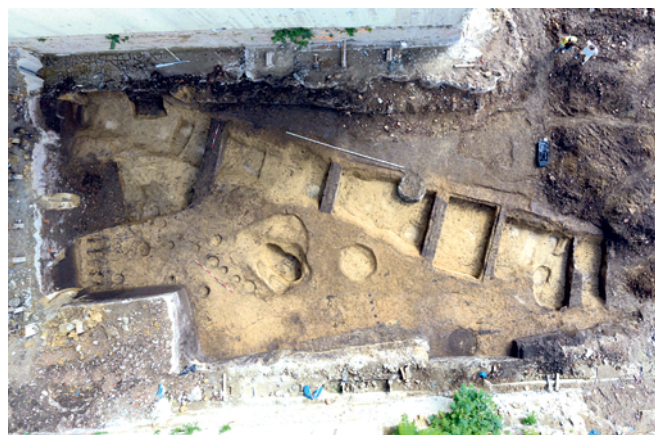
Obr. 4. Brno-Zábrdovice, ul. Bratislavská. Příkop z pozdní doby bronzové.