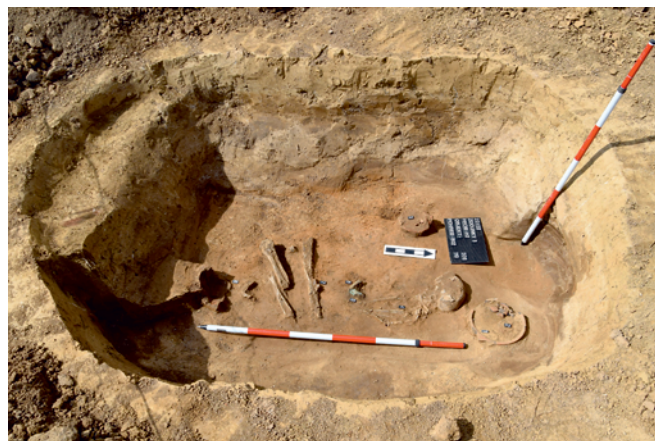
Obr. 28. Zdounky, „Veličky“. Mužský hrob kultury zvoncovitých pohárů.