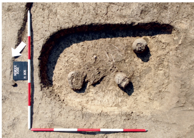
Obr. 26. Víceměřice. Kostrový hrob kultury se šňůrovou keramikou. Fig. 26. Víceměřice. A Corded Ware inhumation burial.

Během průzkumu plochy 2 na lokalitě Němčice, centrální aglomeraci mladší doby laténské, byl zachycen mimo jiné rovněž