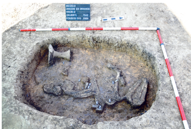
Obr. 25. Uničov. Prozkoumaný hrob H2 lengyelské kultury. Fig. 25. Uničov. Excavated Grave H2 of the Lengyel culture.