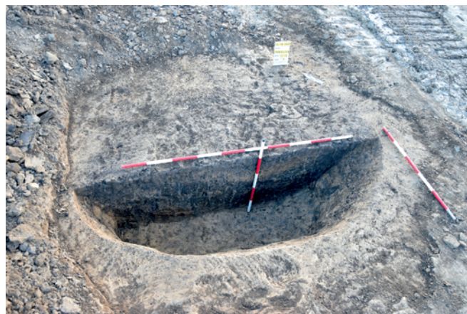
Obr. 23. Troubelice. Objekt kultury nálevkovitých pohárů.

Konopová, M. 2013: Sídliště nálevkovitých pohárů v Lázcích u Uničova a osídlení této kultury na Uničovsku . Rkp. bakalářské práce. Univerzita Palackého v Olomouci. Filozofická fakulta. Katedra historie. Uloženo: Katedra historie Filozofické fakulty Palackého Univerzity v Olomouci.