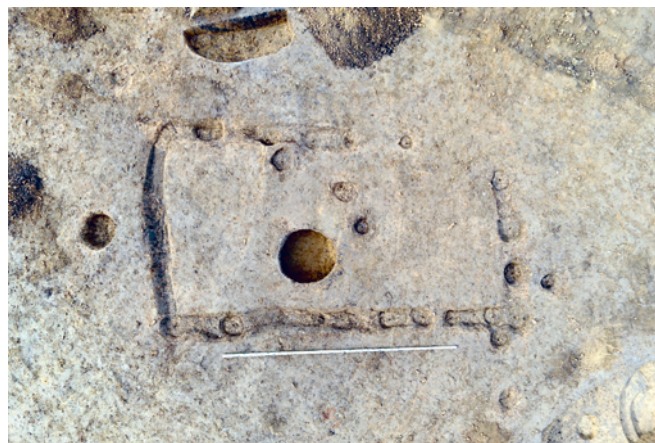
Obr. 24. Uničov. Půdorys domu lengyelské kultury (vyšší struktura 12).

Raritou na této důležité lokalitě se stal nález tří kostrových hrobů (H1–H3), dvojrohob v zásobní jámě (obj. 1105) a nález „depotu“ sedmi nádob na dně zásobnice (obj. 1680; identifikovány tři pohárky). Hroby mají obdélný či oválný půdorys s rozměry 1,25–1,36 × 0,94–1,04 × 0,22–0,24 m. Skelety byly dochovány ve špatném stavu. V zásypu dětského hrobu H1 se zachoval mléčný zub, u jihozápadního okraje se nacházela keramická nádoba (obr. 25). V jihozápadním rohu jámy ležela na boku mísa na nožce, v místě trupu byla zachycena hrouda červeného barviva, okolo trupu čepele štípaná industrie (5 ks) a kančí kel. Hrob H3 obsahoval skelet ženy ve skrčené poloze na levém boku, s orientací J–S. V jihovýchodním rohu hrobové jámy byla zachycena keramická nádoba. Unikátnost nálezové situace podtrhuje místo nálezů hrobů. Hroby byly zachyceny uvnitř starších domů kultury s lineární keramikou 05 (H1) a 15 (H2 a H3).