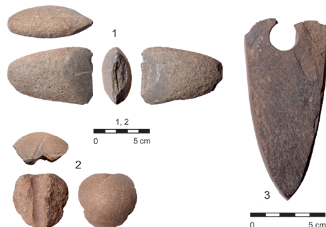
Obr. 17. Opava-Vávrovice, „Kopec“. Eneolitická kamenná industrie.

Fig. 16. Opava-Vávrovice, 'Kopec'. Pottery fragments 1, 2, 4 – Globular Amphora culture; 3 – probably the Bell Beaker culture. Drawing by J. Motěšický.