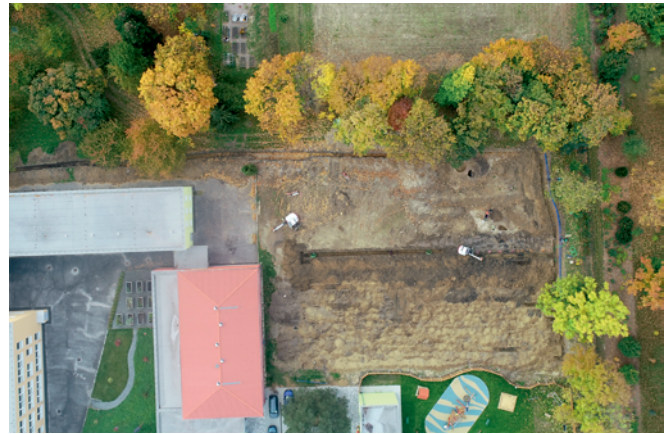
Obr. 15. Neplachovice. Pohled na výzkum z ptačí perspektivy (snímek pořízen pozemním vrtulníkem DJI PHANTOM 4 PRO+).

Jiří Juchelka, David Galia, Ondřej Klápa