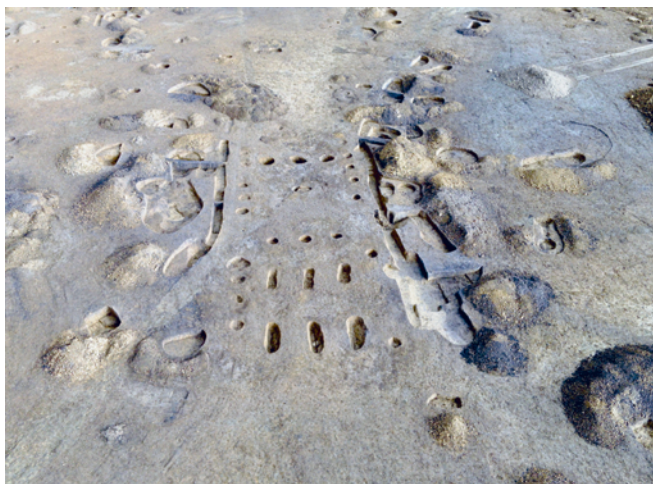
Obr. 45. Uničov. Půdorys domu kultury s lineární keramikou.

Skrývky areálu o velikosti 10 ha zachytily na ploše cca 7 ha osídlení z neolitu a eneolitu. Celkově bylo prozkoumáno 1764 sídlištních objektů a tři kostrové hroby. Neolitické osídlení se pojí s osadou kultury s lineární keramikou, které náleží 19 půdorysů nadzemních dlouhých domů (vyšší struktura: 2–11, 13–16, 18–23 a 25), dlouhé stavební jámy doprovázející domy, zásobní