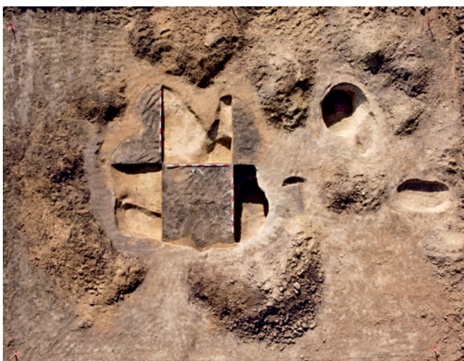
Obr. 43. Šelešovice. Kolmý snímek plochy výzkumu s centrálním hliníkem lengyelské kultury.

Práce na archeologických výzkumech na katastru obce Šelešovice, v trati „Pod Rozdíly“ probíhaly v letech 2015 až 2017 (Bartík et al. 2018, 11–13) a byla při nich vybudována základní technická vybavenost pro novostavby rodinných domů. V předchozích etapách zde bylo prozkoumáno několik desítek archeologických objektů náležejících k sídlištím lengyelské kultury, lužické kultury doby bronzové a raného středověku. V roce 2022 byl realizován výzkum na jedné z posledních, dlouhodobě nezastavěných parcel (parc. č. 476/10) v jižní části lokality. V souladu s doposud zjištěnými skutečnostmi byly prozkoumány tři raně středověké objekty (viz svazek Středověk a novověk), jeden rozsáhlý hliník kultury s moravskou malovanou keramikou