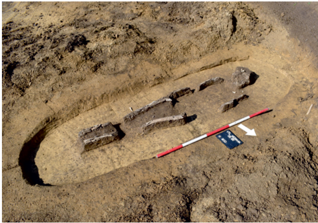
Obr. 42. Šardice. Nedatovaný kostrový hrob. Fig. 42. Šardice. Undated inhumation grave.