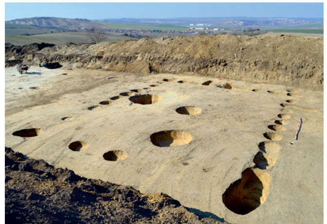
Obr. 26. Nenkovice. Půdorys dlouhého domu kultury s moravskou malovanou keramikou.

Čižmář, I. 2022: Nenkovice (okr. Hodonín). Přehled výzkumů 63(1), 138.