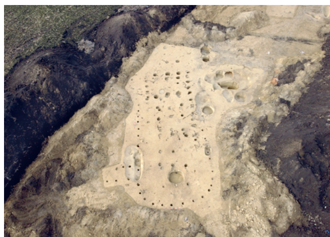
Obr. 13. Karlín. Pohled na atypický půdorys dlouhého domu.

Čižmář, I., Golec, M., Václavíková, D. 2022: Karlín (okr. Hodonín). Přehled výzkumů 63(1), 128.