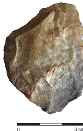
Obr. 23. Moravany. Bifaciální drasadlo.

Škrdla, P., Rychtaříková, T., Nejman, L., Kuča, M. 2011: Revize paleolitického osídlení na dolním toku Bobravy. Hledání nových stratifikovaných EUP lokalit s podporou GPS a dat z dálkového průzkumu Země. Přehled výzkumů 52(1), 9–36. Dostupné také z: https://www.arub.cz/prehled-vydanych-cisel/PV52_1_studie_1.pdf .