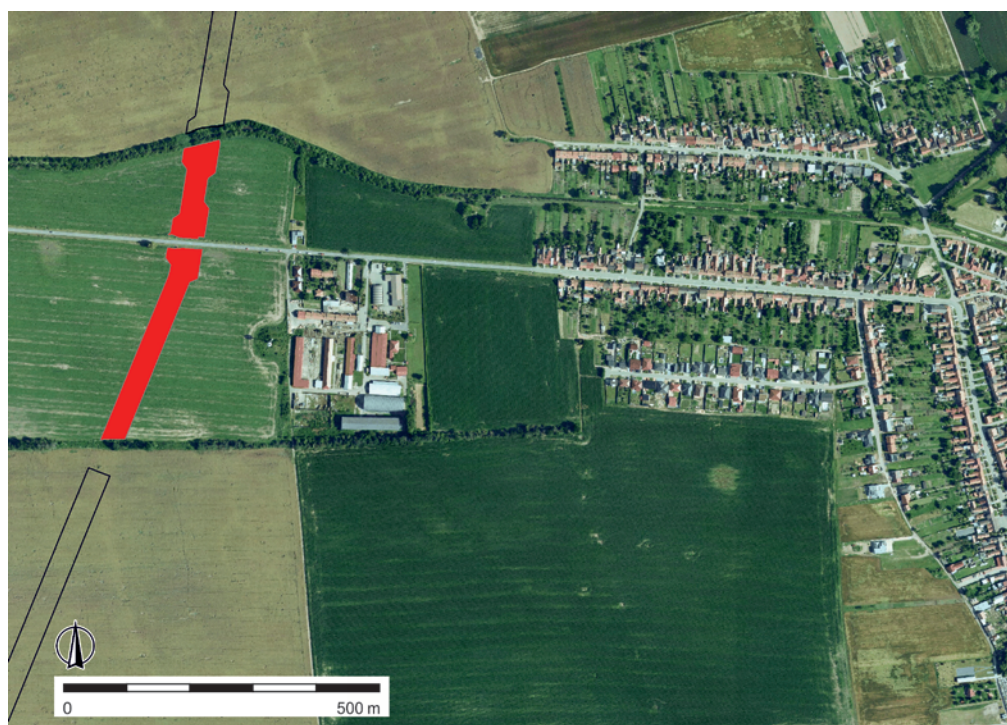
Obr. 80. Prušánky. Lokalizace výzkumu západně od obce. Autor M. Hladík.

Ve všech zemnicích byla odkryta otopná zařízení – kamenné pece, které byly velmi podrobně dokumentovány v několika úrovních. Zjištěné detaily ukazují na způsob jejich výstavby