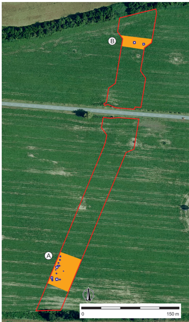
Obr. 81. Prušánky. Zkoumaná plocha s vyznačením prostorů (A, B) s velkomoravskými objekty. Autor M. Hladík.

Dosavadní výzkumy této lokality naznačují, že šlo o poměrně rozlehlé sídliště s řídkou strukturou. Fragmentárnost poznání nám však tuto strukturu a tím i funkční pozici v rámci celého socioekonomického systému zázemí raně středověkých mocenských center dosud nedovolují plně pochopit. Jde o lokalitu, která by si zasloužila budoucí systematický plošný výzkum. Právě otázky vztahu centra a zázemí a socioekonomického obrazu interakce mezi těmito dvěma „světy“ patří k jedněm ze zásadních pilířů našeho současného teoretického výzkumu (Hladík 2020, zde další literatura; Hladík et al. 2021).