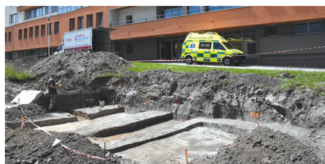
Obr. 85. Přerov. Pohled na zkoumanou plochu od severu.