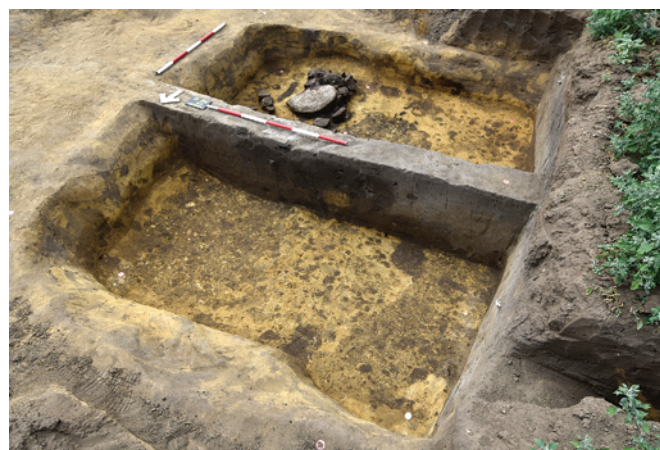
Obr. 84. Prušánky. Zahloubený dům (kontext 4515, plocha A).