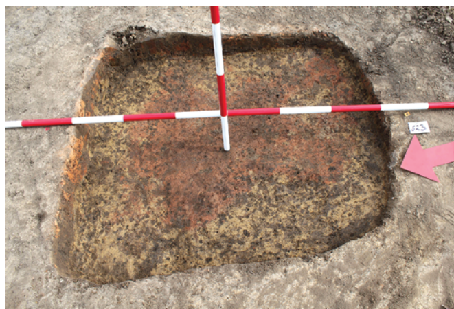
Obr. 68. Opava. Objekt 523 – „ploščatka“.

Při archeologickém výzkumu bylo získáno celkem 1083 archeologických předmětů, na jejichž základě je možné předpokládat, že lokalita fungovala na přelomu 12. a 13. století na okraji města – velké kupecké osady (oficiální městský status získala Opava v roce 1215; Bakala 2002), její zánikový horizont je kladen do 13. století. Jeden odkrytý objekt náleží kultuře lužických popelnicových polí (č. 512).