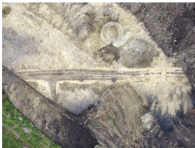
Obr. 48. Kobylí. Odkrytá novověká cesta.