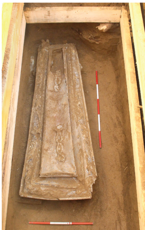
Obr. 25. Brno, Ústřední hřbitov. Kovová rakev s pohřby 802 a 803.

Denisa Fojtíková, Marek Peška, Antonín Zůbek