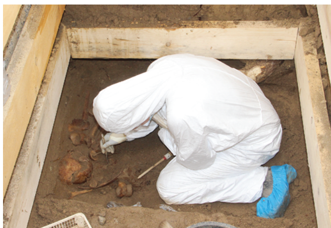
Obr. 24. Brno, Ústřední hřbitov. Odkrytí ostatků pohřbu 801.