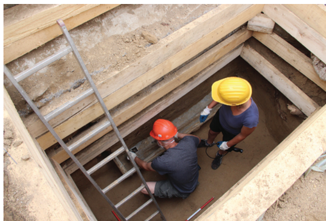
Obr. 26. Brno, Ústřední hřbitov. Ohledání interiéru rakve pohřbu 804 teleskopickou kamerou.

Fig. 24. Brno, Central Cemetery. Recovery of the remains from burial 801.