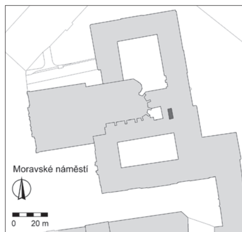
Obr. 17. Brno, Moravské náměstí. Černě vyznačen sledovaný výkop. Archaia Brno z. ú. Fig. 17. Brno, Moravian Square. The monitored trench is marked in black. Archaia Brno.

Archeologický výzkum byl realizován v souvislosti se stavbou „Místodržitelský palác Brno, vestavba osobního výtahu do zrcadla schodiště, Moravské náměstí 1, parc. č. 1, k. ú. Město Brno“ (obr. 17). Jeho provedení zajistila společnost Archaia Brno z. ú. (akce č. A82/2021), terénní část výzkumu se uskutečnila v listopadu 2021.