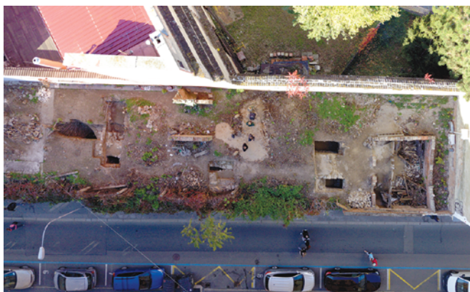
Obr. 13. Brno, ulice Novobranská. Letecký snímek sond na parcelách č. 234/1, 234/2.

První dvě parcely byly vyměřeny v místech někdejšího fortifikačního pásma. Průběh středověkého hradebního okruhu zde dnes v podstatě kopíruje Novobranská ulice. Parcela č. 236/1 zahrnuje části několika středověkých městišť, které byly součástí bloku, jenž se nacházel v jihovýchodním koutě města. Pro přesnou rekonstrukci středověkých parcelních hranic na základě archivních pramenů se nedostává dostatek topografických údajů. Lze předpokládat, že městiště byla orientována k České (dnes Josefské) a Měnišské (dnes Orlí) ulici. Zcela nejasná je situace v koutě vymezeném ulicemi Česká a komunikací, která probíhala