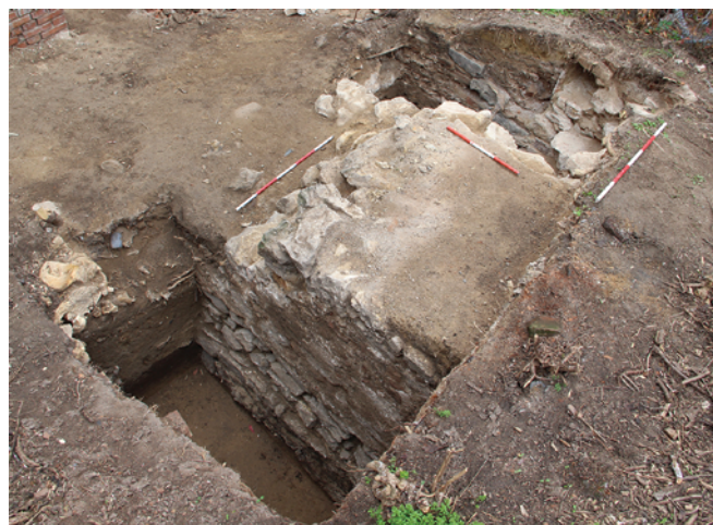
Obr. 15. Brno, ulice Novobranská. Pohled od severozápadu na středověkou hradbu v sondě S3.

Výzkum prostoru při vnitřním líci hradby potvrdil přítomnost situací, které můžeme spojit s okružní cestou. Nejstarší relikty by mohly náležet komunikaci z doby výstavby hradební zdi nebo ještě z předchozího období. Překrylo je souvrství, které dokládá postupné navyšování terénu v tomto prostoru. Spodní partii můžeme klást zřejmě ještě do období středověku, horní část již byla jasně novověká. V její úrovni byly