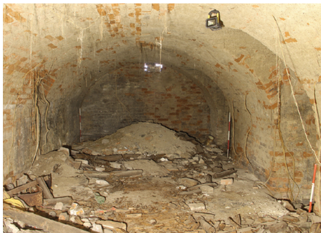
Obr. 16. Brno, ulice Novobranská. Sklep s. s. j. 009 zástavby 19. století. Fig. 16. Brno, Novobranská Street. A 19th-century cellar.