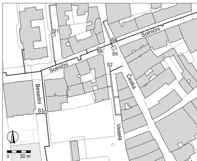
Obr. 5. Brno, ulice Besední, Česká, Solniční, Opletalova a Veselá. Průběh rekonstruovaného plynovodu s vyznačenými úseky s dokumentovanými archeologickými situacemi (sondy S1–S6). Archaia Brno z. ú.

Pouze dílčím způsobem se archeologický výzkum dotknul problematiky předměstí, které těsně za fortifikačním pásmem navazovalo na vlastní město. Postupně se po jeho obvodu vytvořil takřka souvislý pás osídlení, zástavba v severním sousedství se nazývala Před branou Veselou a náležela ke čtvrté