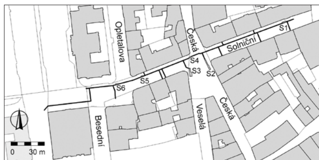
Obr. 8. Brno, ulice Solniční. Průběh rekonstruovaného plynovodu s vyznačenými úseky s dokumentovanými archeologickými situacemi (sondy S1–S6). Archaia Brno z. ú.

V tomto prostoru se podařilo ověřit úroveň povrchu geologického podloží, které představoval půdní horizont – ornice, dosedající na sprašovou návěj. Podloží bylo narušeno výkopem jámy neznámé funkce, která se nacházela v prostoru někdejší středověké ulice. Mohla by pocházet z počátečního období výstavby města ještě před ustálením uliční osnovy. Snad lze připustit také variantu, že šlo o objekt v samotném čele parcely, jež bylo později posunuto a ulice se tak rozšířila. Na povrchu půdního horizontu bylo dokumentováno středověké souvrství. Jeho spodní část, tvořenou planýrkami, lze spojovat s počátky města a budováním hradebního příkopu. Horní partie souvisí zřejmě s provozem komunikace probíhající podél hradby.