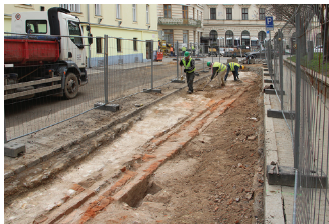
Obr. 6. Brno, ulice Opletalova. Pohled od severu na zdivo novověkého opevnění. Foto Archaia Brno z. ú.

Fig. 5. Brno, Besední, Česká, Solniční, Opletalova and Veselá streets. The gas pipeline reconstruction with highlighted archaeological contexts (trenches S1–S6). Archaia Brno.