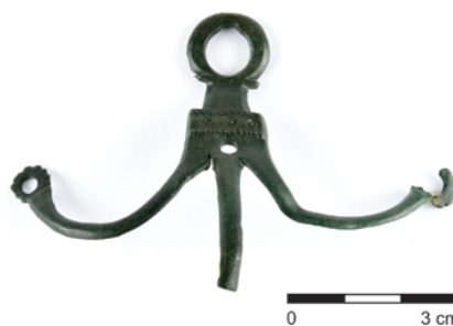
Obr. 8. Rataje. Bronzová aplikace.