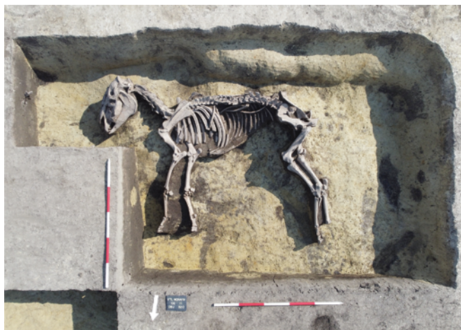
Obr. 2. Kobylí. Kostra koně v chatě.

Zeman, T. 2001: Germánská kostěná a parohová industrie doby římské ve středoevropském barbariku. Sborník prací Filozofické fakulty brněnské univerzity M6, 107–147.