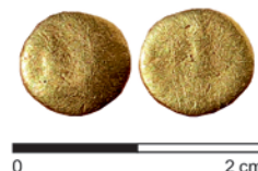
Obr. 17. Přerov. Osmina keltského statéru.