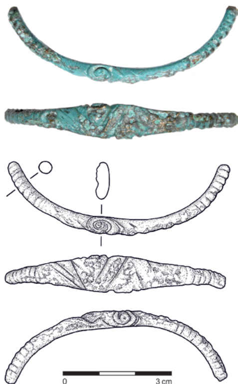
Obr. 14. Přerov – Předmostí. Torzo bronzového náramku. Foto Z. Schenk, kresba P. Holcová.