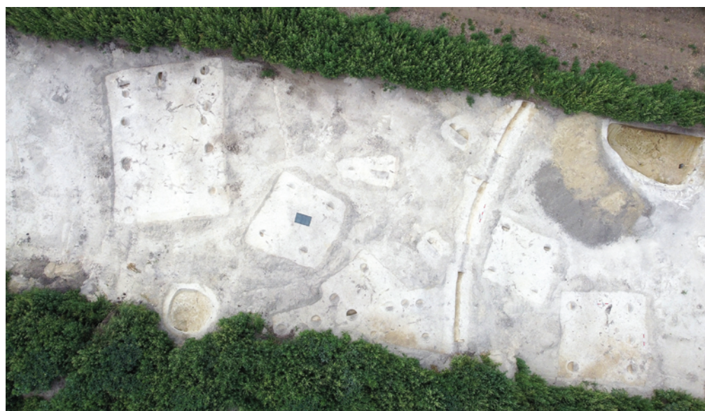
Obr. 4. Čejč. Odkrytá část osady s palisádovým žlabem.