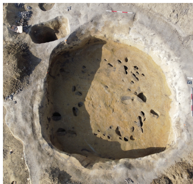
Obr. 5. Čejč. Zahloubená chata z doby halštatské.

Lokalizace: WGS-84 – 48.9300272N, 16.9545897E