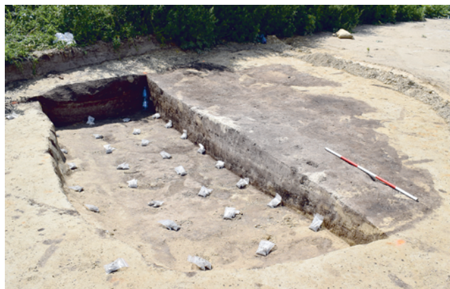
Obr. 3. Čejč. Zahloubená chata z doby laténské po odebrání mikromorfologických vzorků.

Fig. 3. Čejč. La Tène period sunken hut after micromorphological sampling.