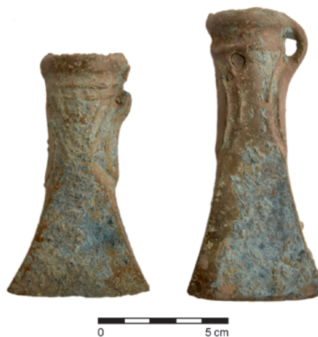
Obr. 9. Prosiměřice. Sekery s tulejkou a ouškem z depotu. Fig. 9. Prosiměřice. The socketed axes from the hoard.